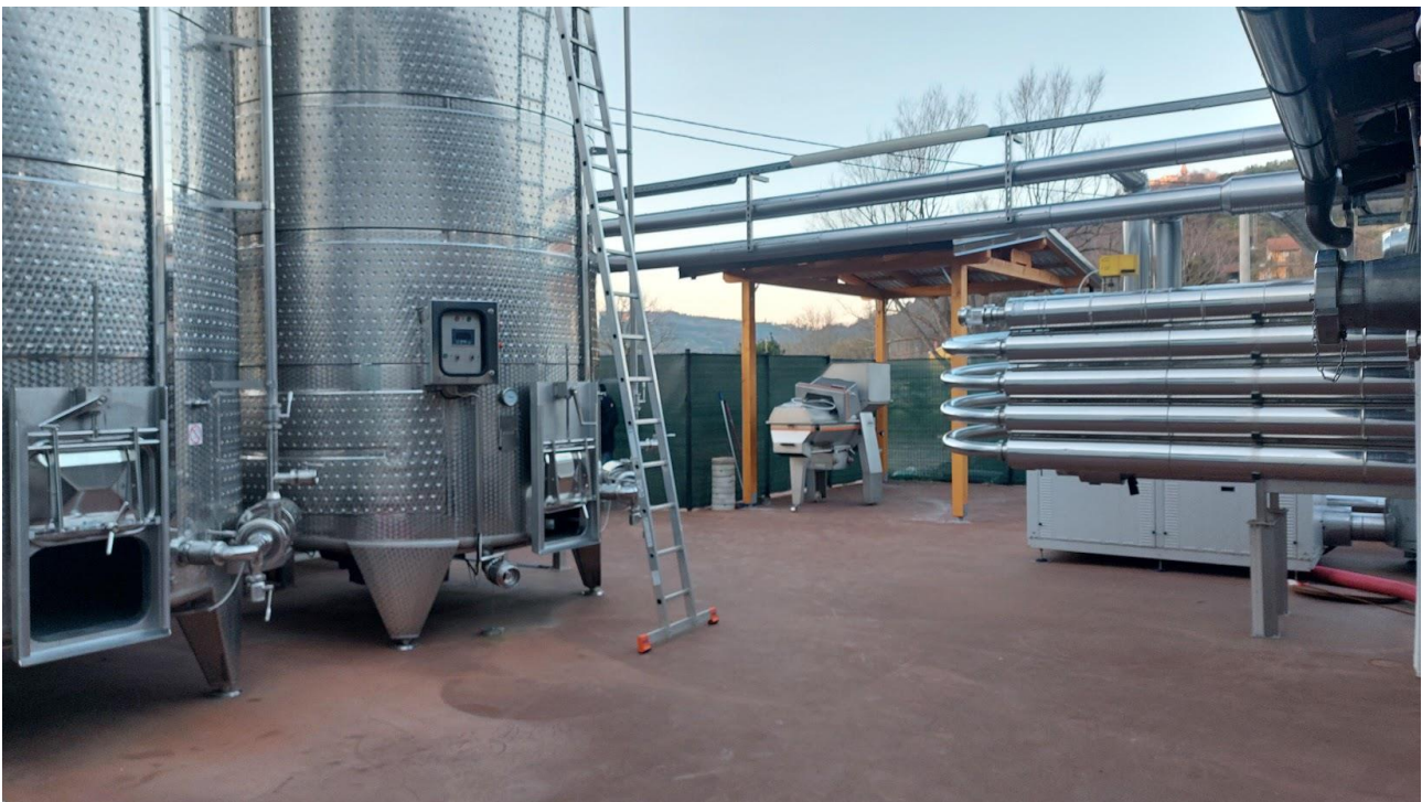
Cantina Vinicola Pribac

avvenuto attraverso la costruzione di percorsi di partecipazione degli abitanti e centralità di governance della cittadinanza per la costruzione delle strategie del Gal e la loro implementazione. Il riequilibrio tra governance istituzionale dei Comuni appartenenti al Gal e possibilità di influenza da parte delle realtà locali ha rappresentato un momento di svolta per l'adozione di strategie di utilizzo dei fondi effettivamente utili e sentite come necessarie dal territorio.