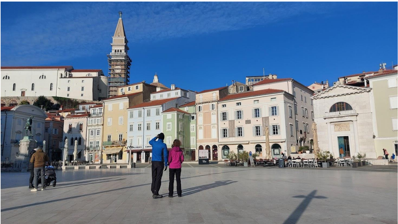
Comune di Pirano

Proprio in relazione al tema della formazione del personale e degli imprenditori, in collaborazione con l' Incubatore Creativo di Istria è stato attivato un corso rivolto proprio al tema dello Sviluppo dell'Economia Circolare e della Sostenibilità all'interno delle imprese e del settore turistico nel territorio.