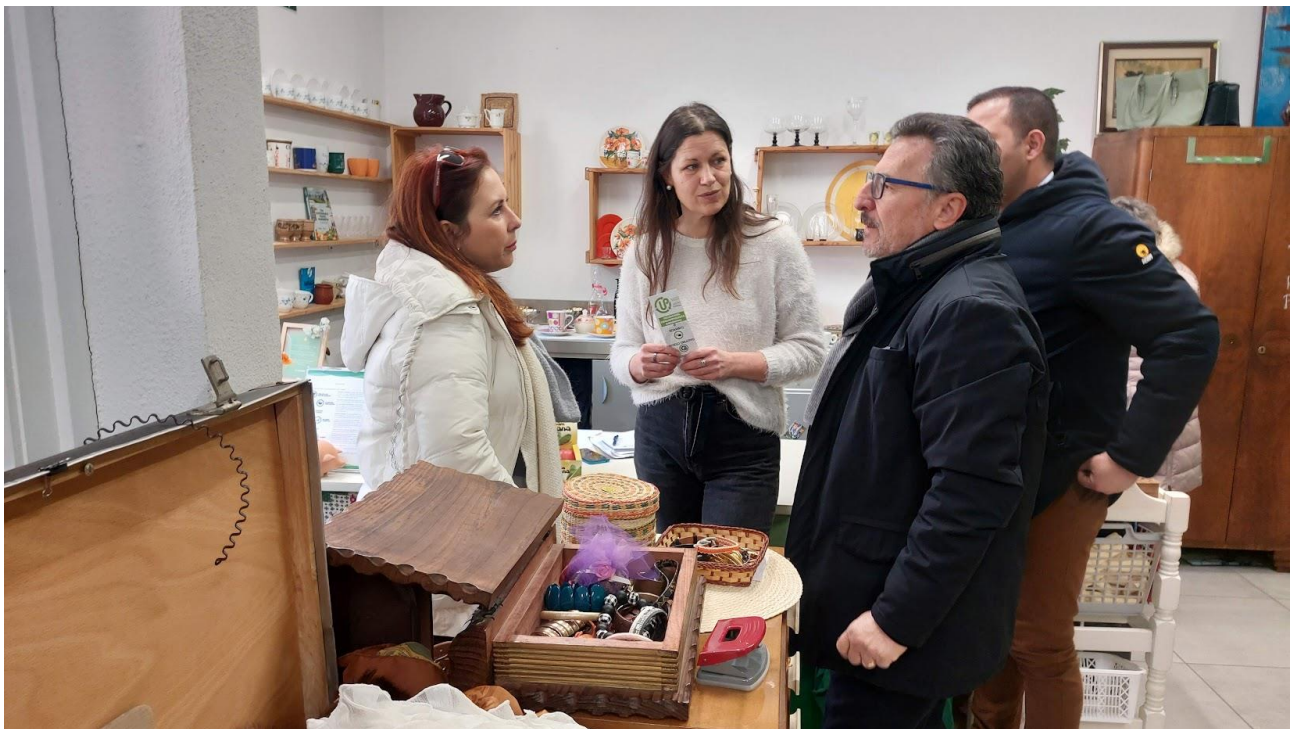
COR – Centro Oggetti Recuperabili

Visita al progetto COR – Centro Oggetti Recuperabili è il primo centro di scambio nella regione litoranea, dove agli oggetti dismessi viene data la possibilità di venire riutilizzati, si trova in centro, in Via Luka Muzec 7, a pochi passi dal mercato cittadino di Isola. Il Centro Oggetti Recuperabili è frutto del progetto intitolato “RIFIUTI RIUTILIZZABILI – Trasferimento delle buone pratiche di riduzione dei rifiuti con metodi innovativi ecocompatibili” , promosso dal GAL Zelena Istra e cofinanziato da parte del Ministero per lo sviluppo economico e le tecnologie e dal Fondo europeo di sviluppo regionale.