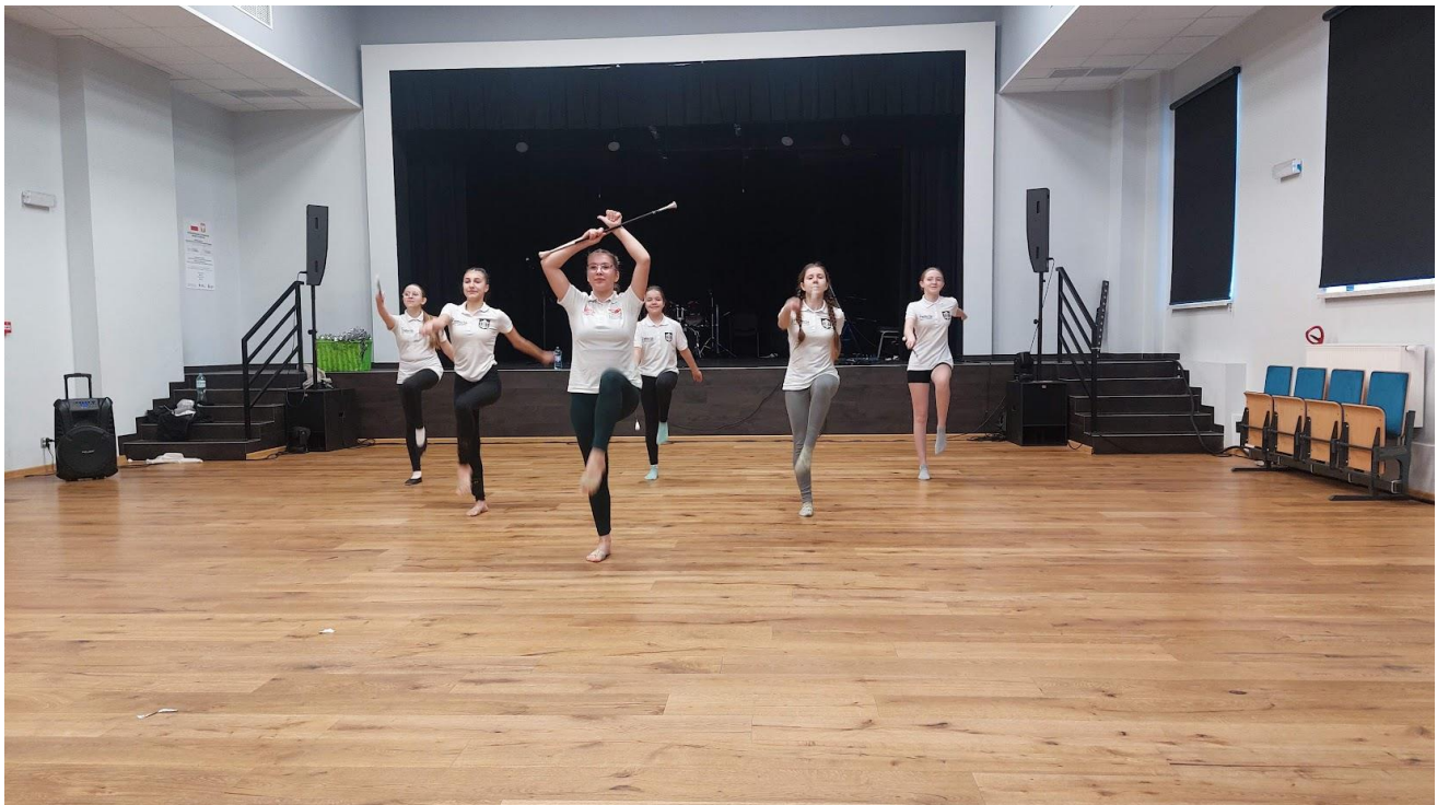
Centrum Integracji Społeczno

Centrum Integracji Społeczno - Zawodowej w Ogrodzieniu , visita degli spazi del centro di integrazione e sportivo supportato da fondi ministeriali e del Gal. Il centro opera rappresenta un fulcro di aggregazione all'interno delle quali si sviluppano attività sportive che partecipano a gare anche a livello agonistico internazionale.